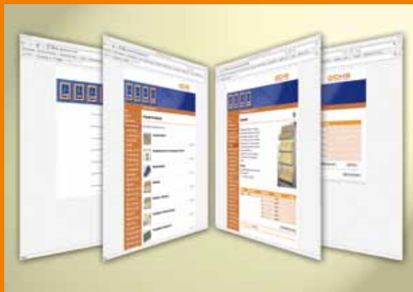
Auf Wunsch programmieren wir Ihren eigenen passwortgeschützten Online-Bestellkatalog