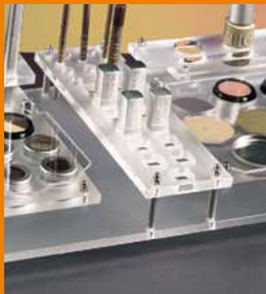
Plexiglasdisplay aus Satine zur Aufnahme verschiedenster Kosmetikartikel