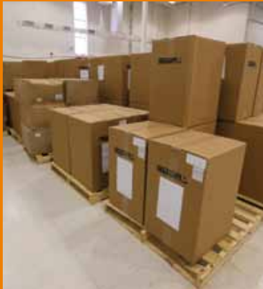
Logistik und Versand