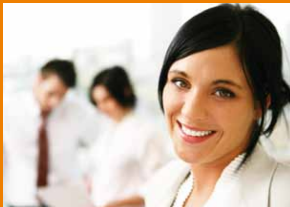
Gerne richten wir Ihnen eine projektbezogene Hotline ein