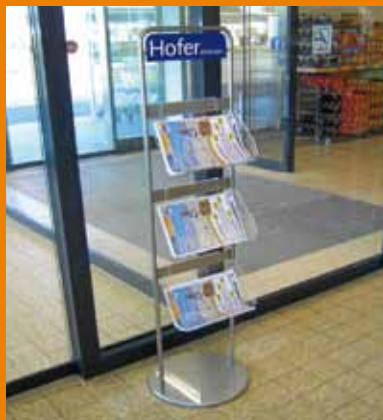
Standdisplay aus Edelstahl mit eingehängten Acryltaschen